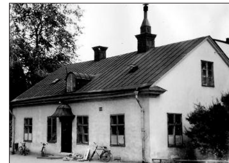
I detta hus på Järnbrogatan 40 i Uppsala fanns det Gelertsenska matlaget.