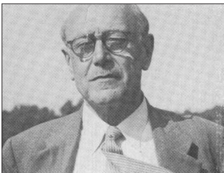
För den unge Folke Henschen var Karlfeldt den stora poetiska upplevelsen.

Långt senare kom Henschen av en tillfällighet att bli ägare till ett Karlfeldtporträtt av JAG Acke. En vagabondisk man erbjuder honom ett porträtt av den unge Karl-